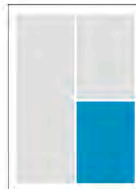
1/4 Seite 4c 90 x 130 mm (B x H) 400,00 €*