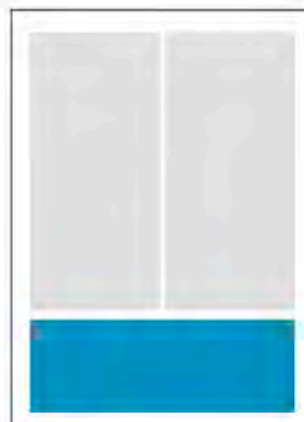
1/4 Seite quer 4c 185 x 60 mm (B x H) 400,00 €*