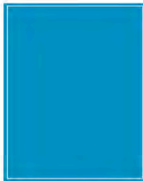
1/1 Seite 4c, Innenteil: 210 x 297 mm** (B x H) 1400,00 €*