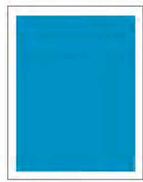
1/1 Seite 4c, Innenteil: 185 x 265 mm (B x H) 1400,00 €*