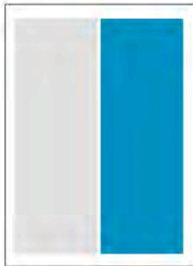
1/2 Seite hoch, 4c 90 x 265 mm (B x H) 800,00 €*