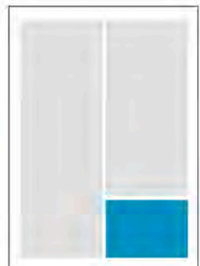
1/8 Seite 4c 90 x 60 mm (B x H) 250,00 €*