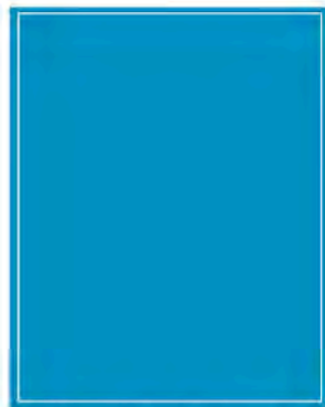
1/1 Seite 4c, 210 x 297 mm** (B x H) U2 + U3: 1600,00 €* U4: 1800,00 €*